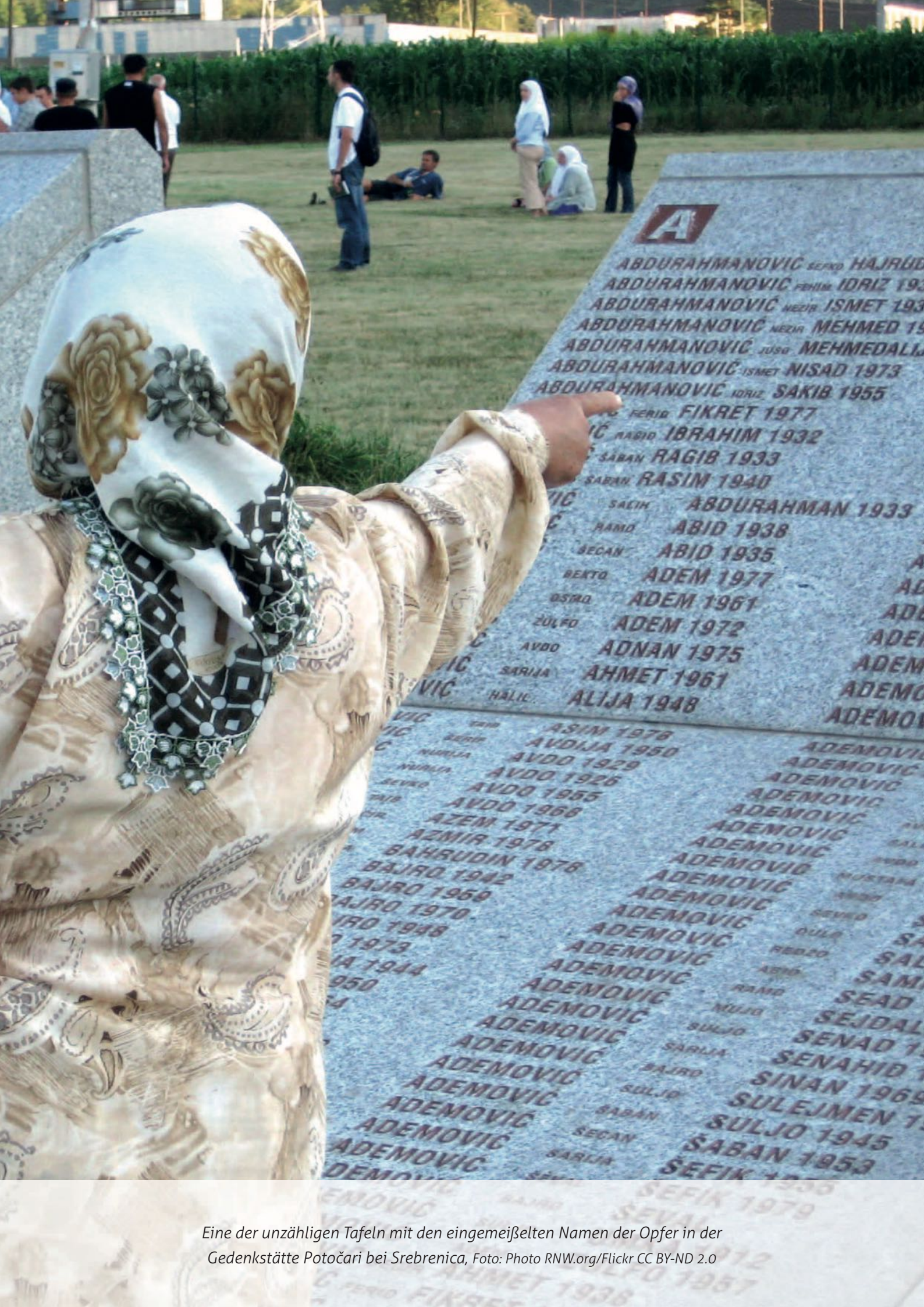
Eine der unzähligen Tafeln mit den eingemeißelten Namen der Opfer in der Gedenkstätte Potočari bei Srebrenica