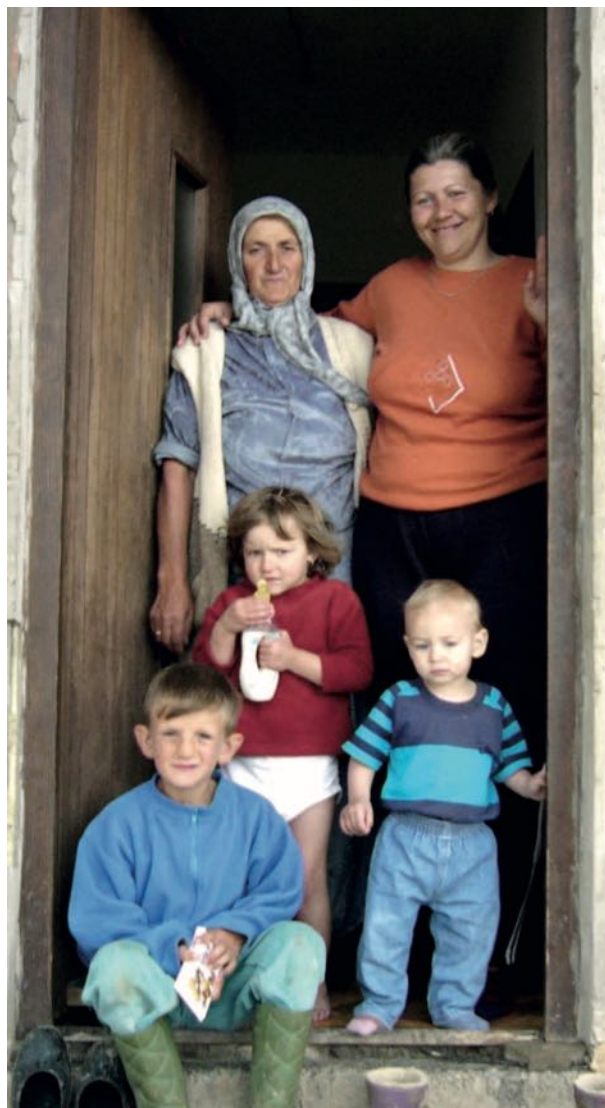
Eine Rückkehrerfamilie aus Srebrenica, der im Rahmen eines GfbV-Hilfsprojekts eine Kuh geschenkt wurde.

ist Direktorin der GfbV-Bosnien und Herzegowina