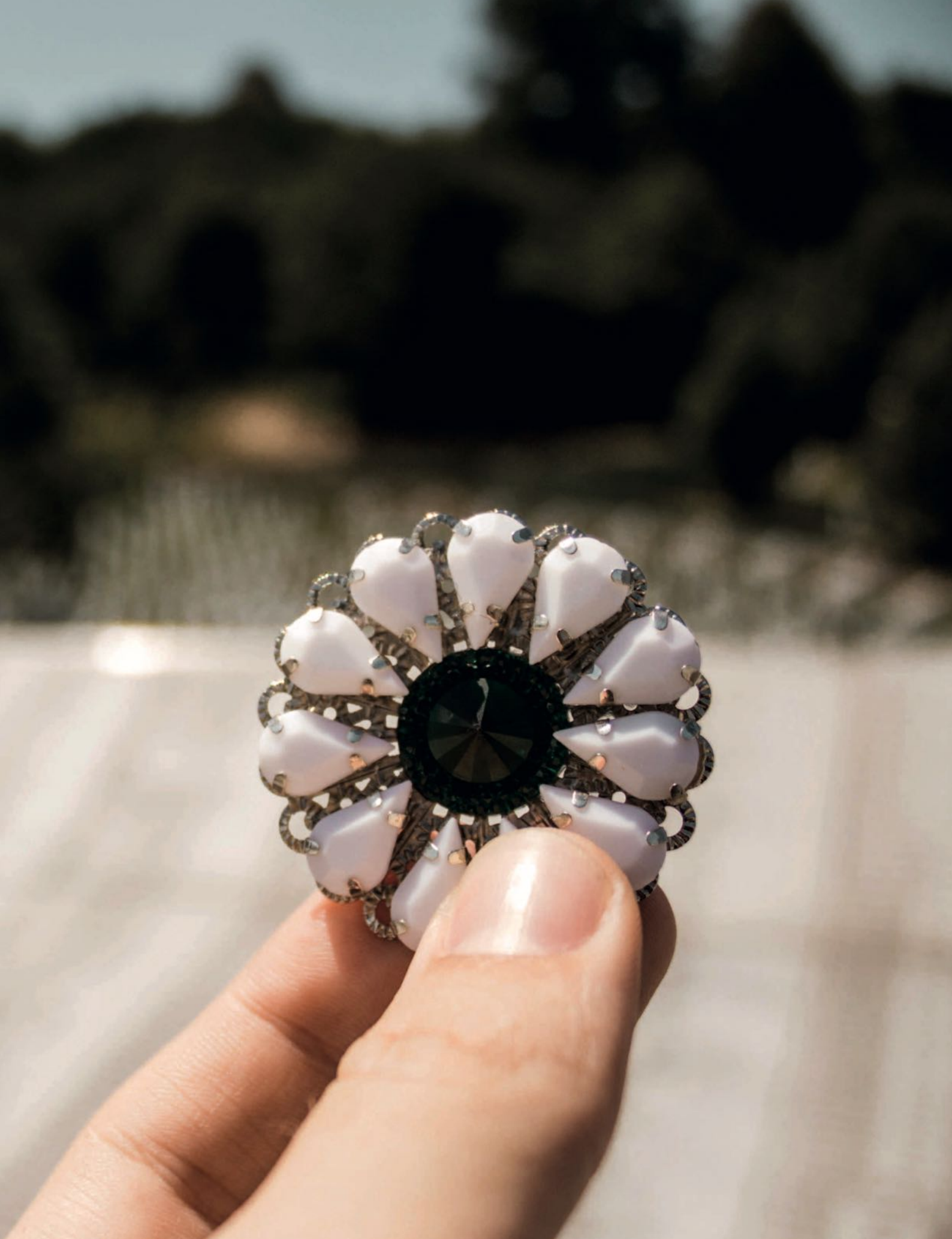
Die „Blume von Srebrenica“