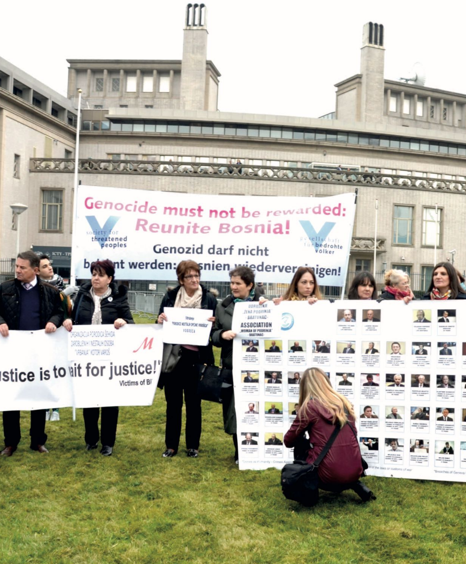
GfbV-Mahnwache mit Angehörigen von Srebrenica-Opfern sowie Exilbosnier*innen vor dem Kriegsverbrechertribunal in Den Haag während der Urteilsverkündung gegen Radovan Karadžić am 24. März 2016