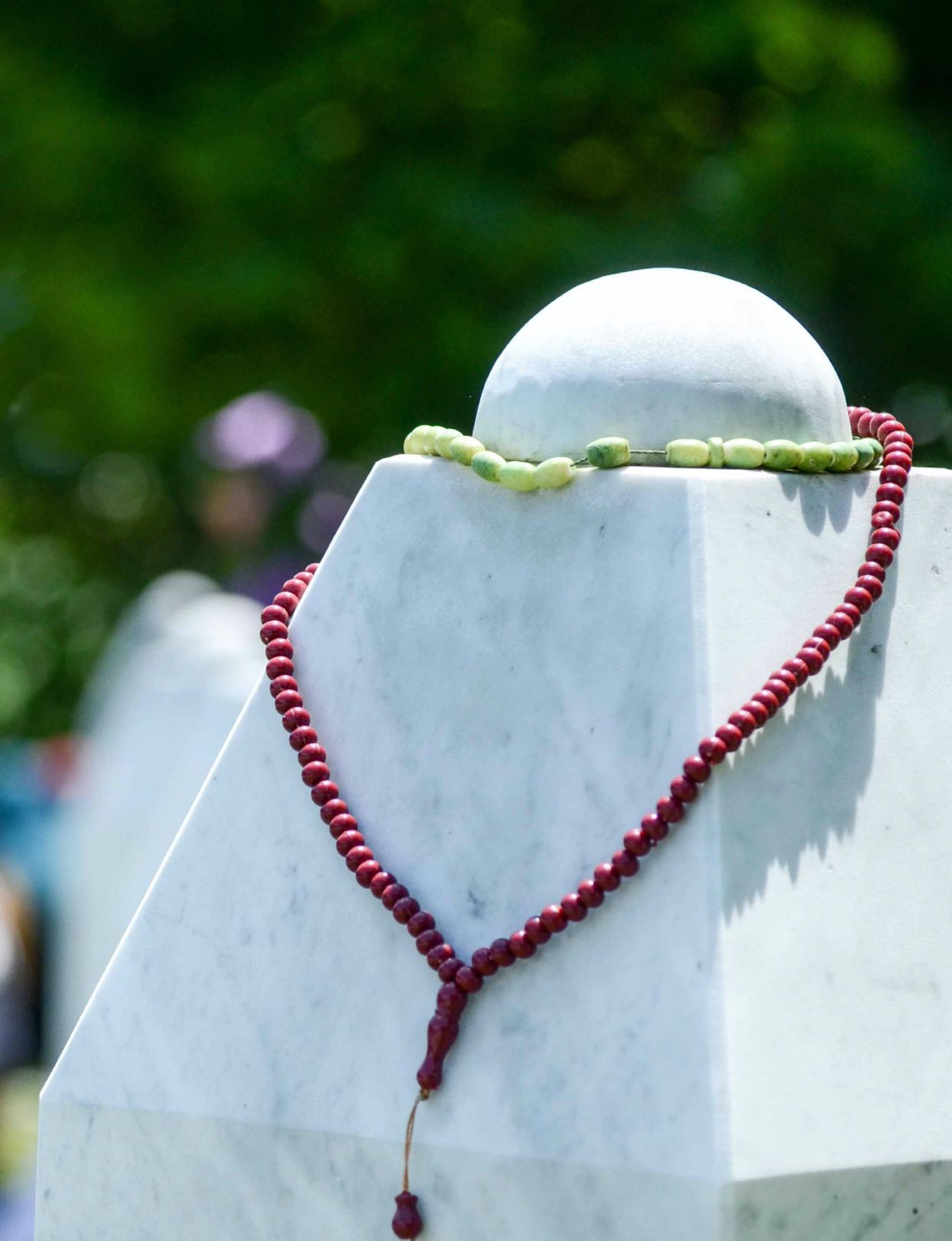
Grabstein auf dem Friedhof der Gedenkstätte Potočari in der Nähe von Srebrenica, Foto: Archiv