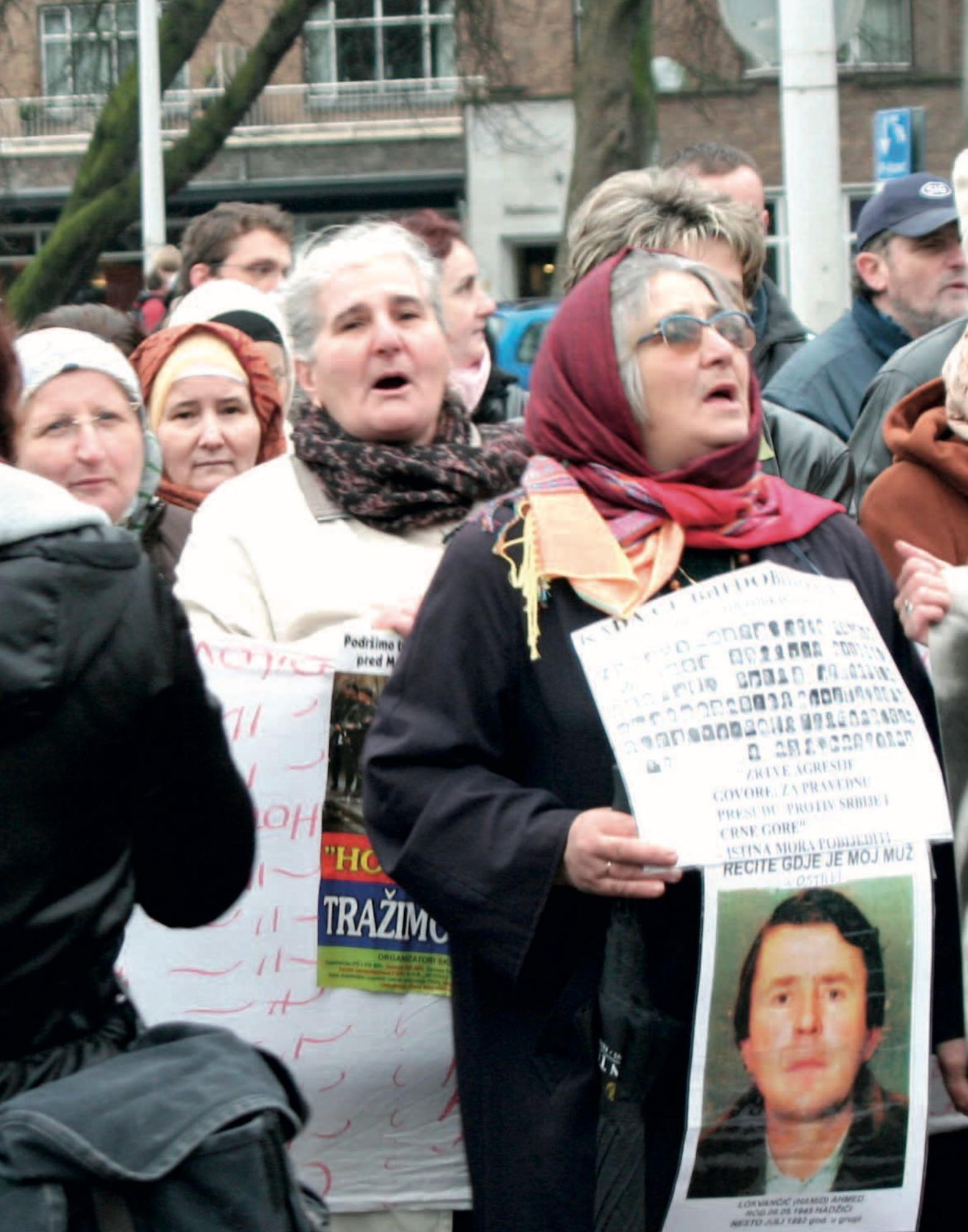
Mahnwache der Frauen von Srebrenica mit der GfbV vor dem Internationalen Gerichtshof in Den Haag 2007